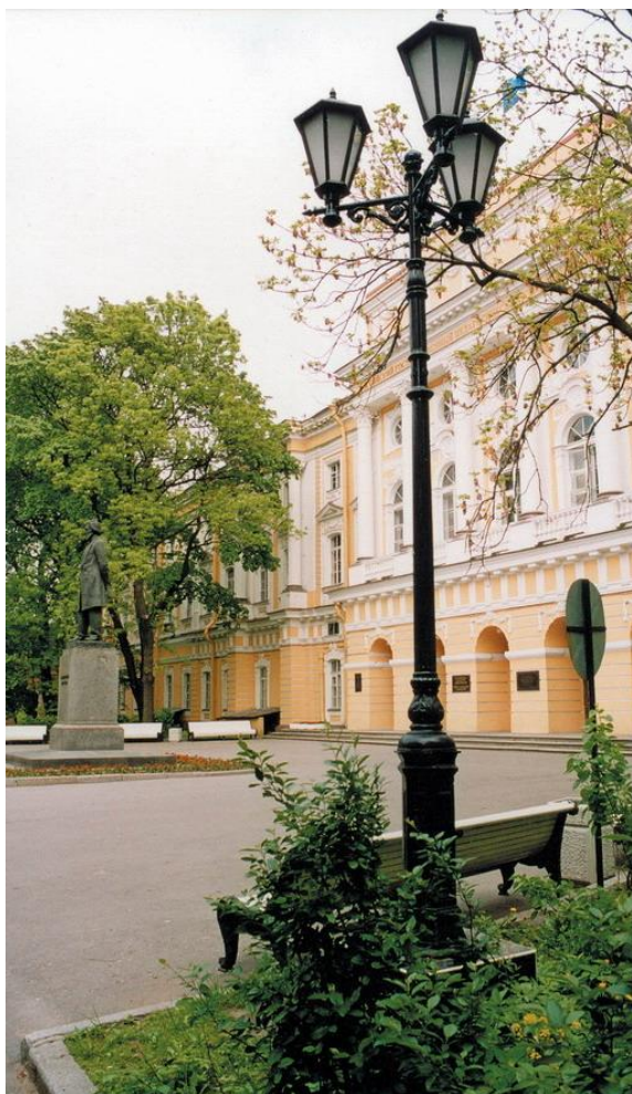
РГПУ им. А.И. Герцена. Главное здание